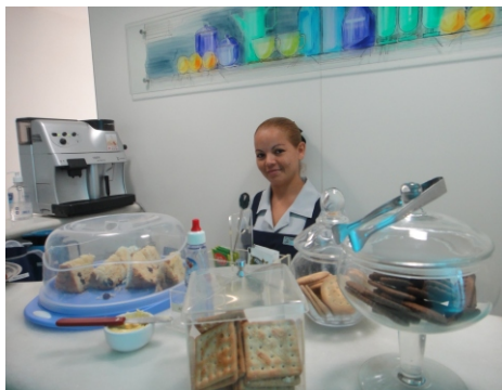
Café da Manhã (unidade Farol)