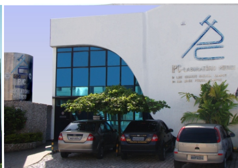
Unidade I - Farol