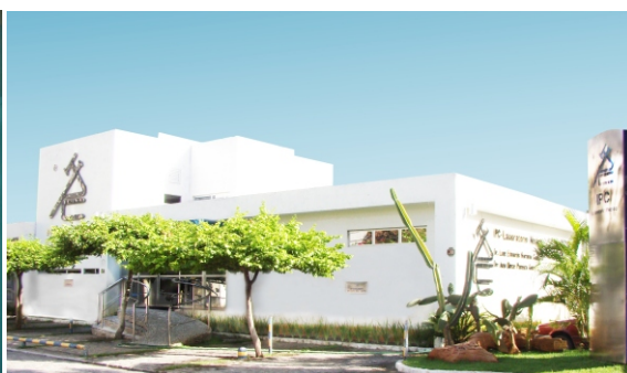
Unidade II - Ponta Verde