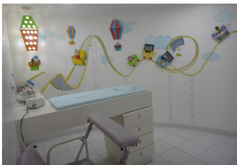
Coleta Infantil (unidade Ponta Verde)