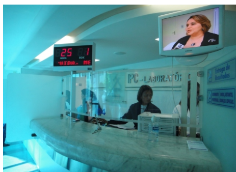
Recepção Unidade Farol